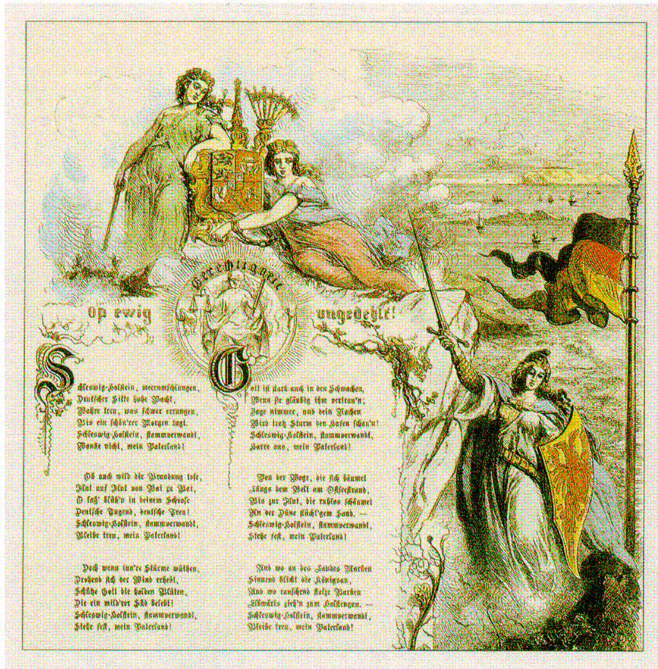
Patriotischer Druck des Schleswig-Holstein-Liedes Mitte des 19. Jahrhunderts