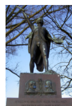
Denkmal in Schleswig von 1896 für das „Schleswig Holstein-Lied