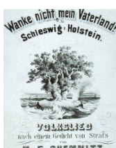
Titelblatt des Schleswig-Holstein-Liedes vom 24. Juli 1844